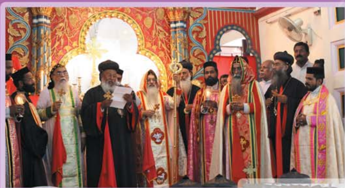
പുണ്യശ്ലോകനായ പുത്തൻകാവിൽ കൊച്ചുതിരുമേനിക്ക് ബഹുമാന നാമപ്രഖ്യാപനം